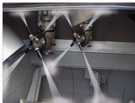
Têtes A80R installées dans un mélangeur à deux arbres